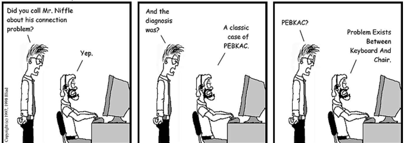
USER FRIENDLY by Illiad